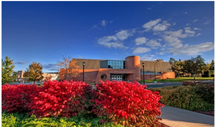
Wu Conference Centre/College of Extended Learning